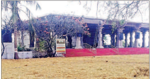
మహాదేవపురం జాతరకు వేశాయే